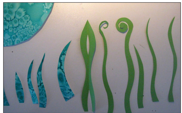
Etape N° 2