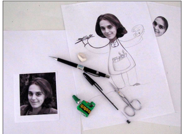
Etape N° 1

D'ailleurs, si vous avez un carnet de croquis, je vous conseille de garder ces esquisses à l'intérieur.