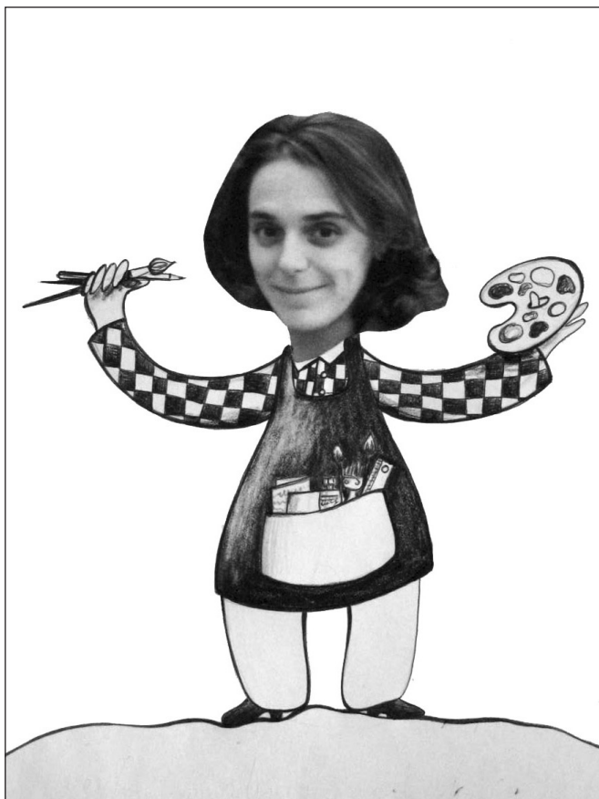
Un autoportrait en professeur d'arts plastiques ( exemple personnel )