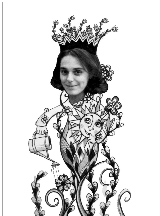
Un autoportrait en Reine des fleurs ( exemple personnel )