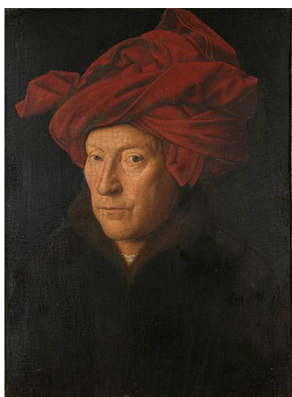
« Homme au turban rouge » Jan van Eyck , vers 1433 ( né vers 1390, mort en 1441) National Gallery- Londres