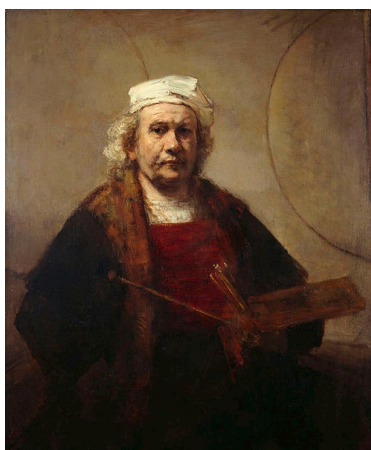
« Autoportrait aux 2 cercles » Rembrandt , vers 1665 ( né en 1606, mort en 1669)