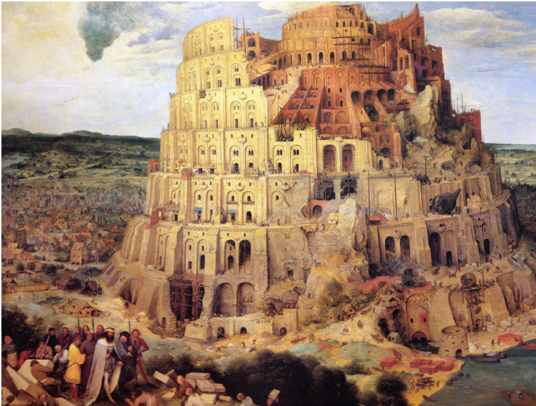
La grande tour de Babel vers 1563 de Pieter Bruegel ( né en 1525, mort en 1569 ) Musée d'Histoire de l'art de Vienne