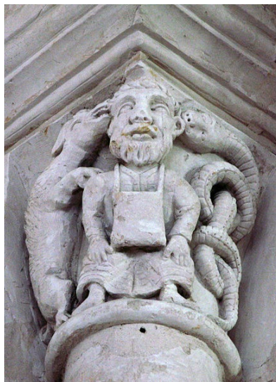
Chapiteau roman église de Lucheux