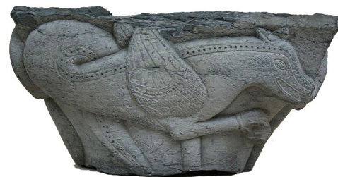
Chapiteau roman de l'abbaye de Saint-Amand-les Eaux