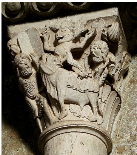
Chapiteau roman de la basilique de Vézelay XI e siècle