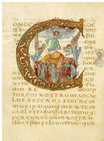
Sacramentaire de Drogon - Metz Initiale C ornée de l'Ascension du Christ