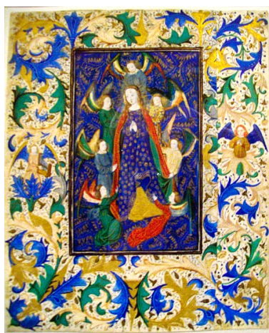
Assomption de Marie Feuillet d'un livre d'heures - Bruges vers 1450-1475 Musée Cluny