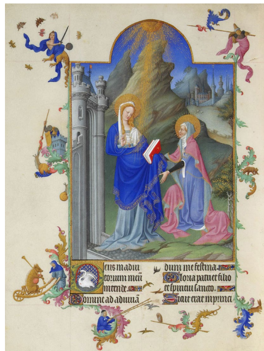
Les riches heures du duc de Berry, La visitation enluminure des frères Limbourg (né vers 1380, mort vers 1416) Musée Condé