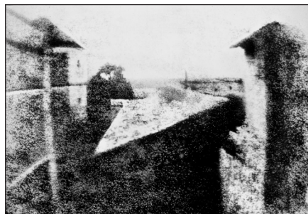
Nicéphore Niépce Point de vue du Gras - 1826 la plus ancienne photographie