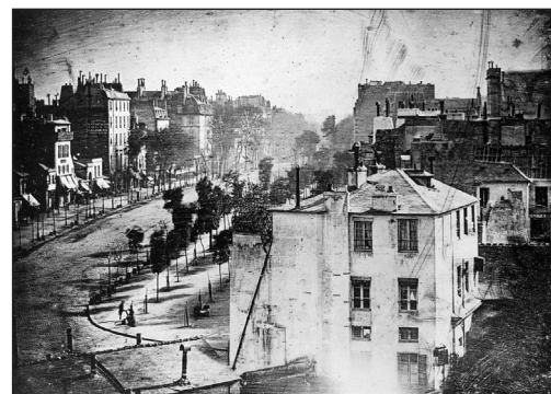
Louis Daguerre Boulevard du Temple à Paris l'un des premiers daguerréotypes vers 1838