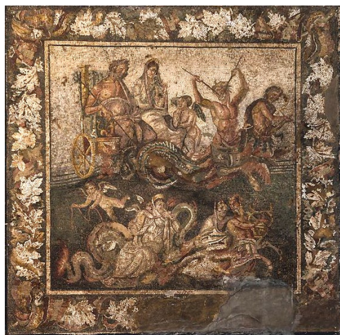
Poseïdon et Amphitrie Pompeï, fin du II e siècle AV. J.-C.. Musée archéologique de Naples