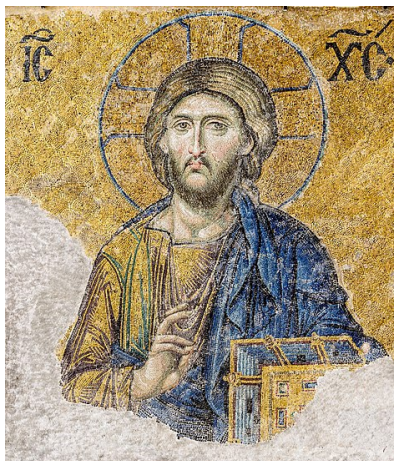
Détails - Christ de Sainte Sophie à Istanbul, vers 1261.