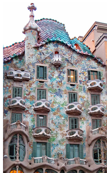
Détails - Façade de la Casa Batlló 1904 - 1906 de A. Gaudy (né en 1852, mort en 1926)