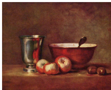
Chardin vers 1760 Nature morte au gobelet d'argent Musée du Louvre