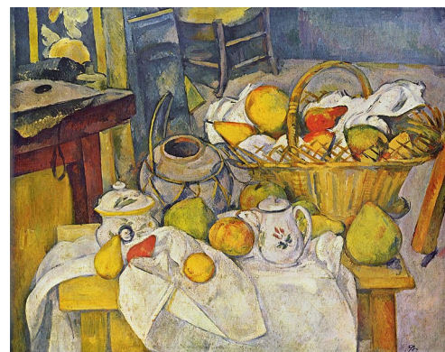
Paul Cézanne vers 1888 Nature morte au panier Musée du Louvre