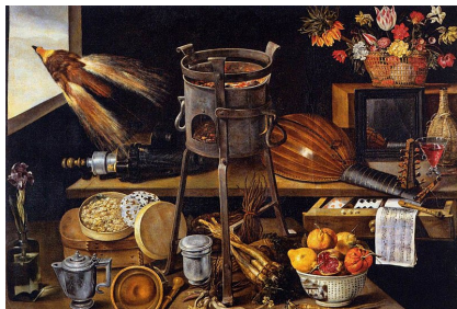
Jacques Linard vers 1627 Les 5 sens et les 4 éléments Musée du Louvre