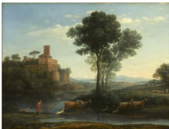
Paysage avec le voyage de Jacob vers 1677 de Claude Gellée - dit Le Lorrain (né vers 1600, mort vers 1682) Sterling and Francine Clark Art Institute