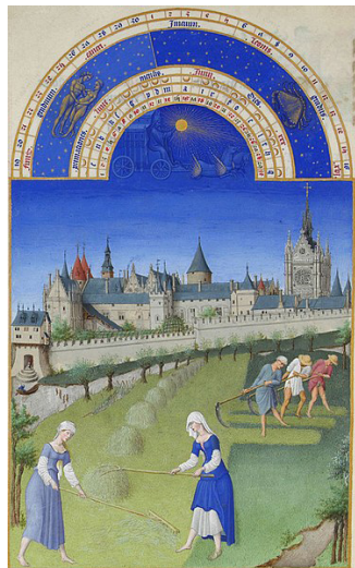
Les très riches Heures du duc de Berry - vers 1410 des frères Limbourg (nés vers en 1380, morts en 1416) Musée Condé - Chantilly