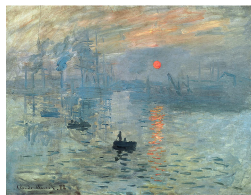
Impression soleil levant de Claude Monet, 1872 (né en 1840, mort en 1926) Musée Marmottan - Paris