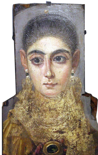
Portrait de jeune femme dite «L'Européenne », II e siècle Musée du Louvre