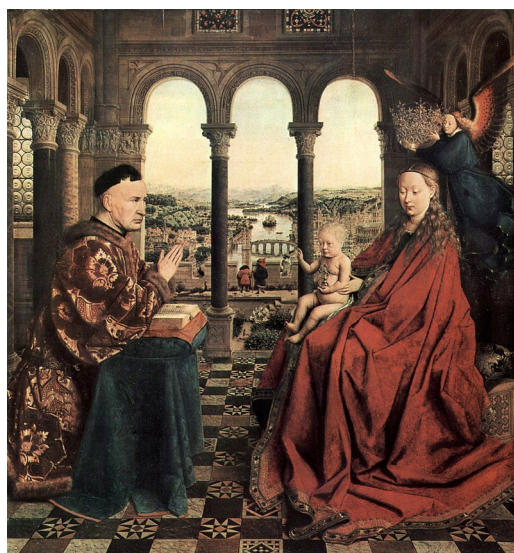
La vierge au chancelier Rolin de Jan Van Eyck, vers 1435 ( né en 1390, mort en 1441) Musée du Louvre