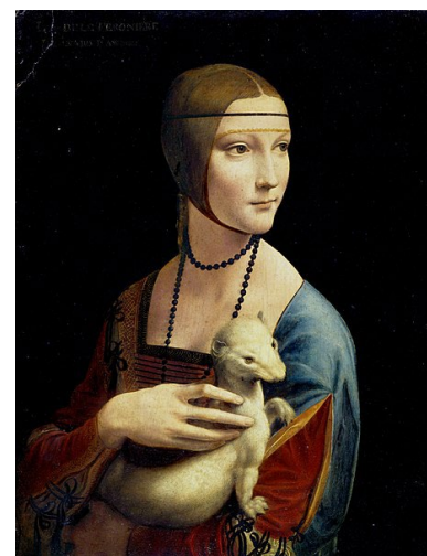
La Dame à l'hermine Ce portrait pourrait représenté C.Gallerani Léonard de Vinci, vers 1490 ( né en 1452, mort en 1519) Musée National de Cracovie