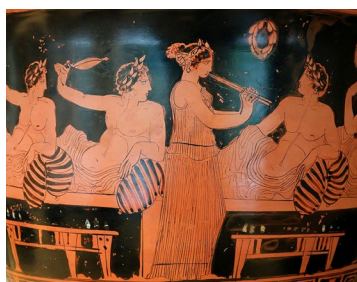
Scène de fête - Symposium