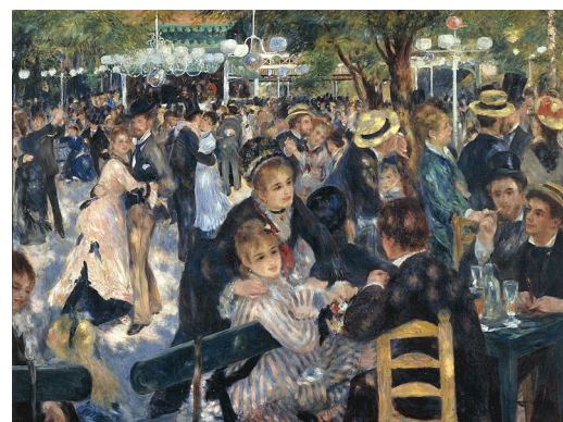
Le Moulin de la Galette - 1876