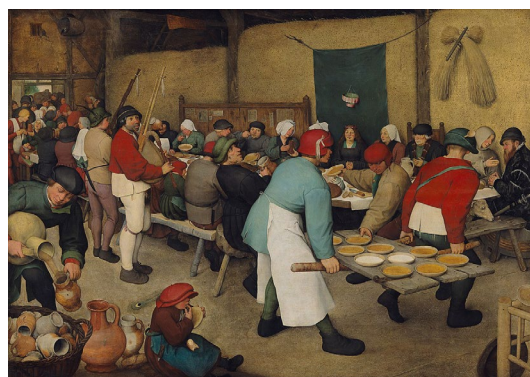
Le repas de noce - vers 1568