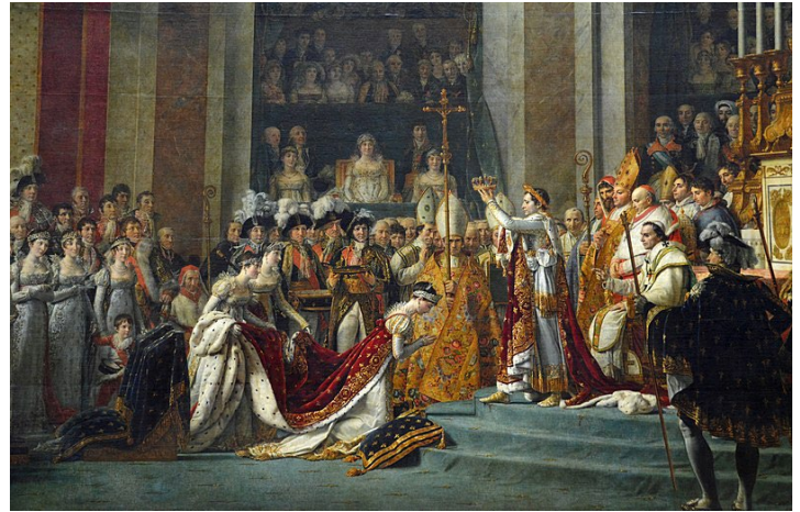
Le Sacre de Napoléon - 1804 Jacques-Louis David (né en 1748, mort en 1825) Musée du Louvre