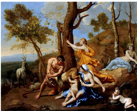
L'enfance de Jupiter - 1636 ou la nourriture de Jupiter - Zeux Nicolas Poussin (né en 1594, mort en 1665) Dulwich Picture Gallery