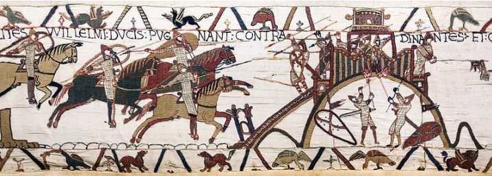
Tapiserie de Bayeux - vers 1070 Scène 19 - Siège de Dinan. Musée de Bayeux