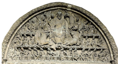
Tympan sculpté de l'abbaye de Saint-Pierre de Moissac - France Moyen-âge VIII e et le XV e siècle