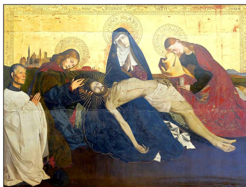
Pietà de Villeneuve-lès-Avignon vers 1457 de Enguerrand Quarton (né vers 1411, mort vers 1466) Musée du Louvre