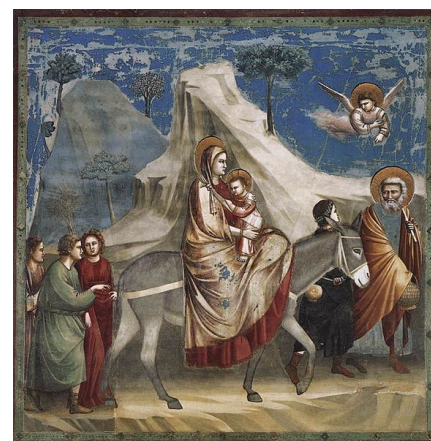
Fresque sur la vie de Jésus- Scène biblique de la fuite en Egypte Eglise de l'Arena à Padoue - Italie vers 1304 1306 de Giotto di Bondone (né en 1266, mort en 1337)