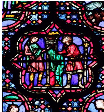
Détail d'un vitrail Sainte Chapelle à Paris