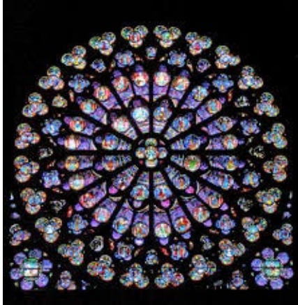
Rosace Sud Notre Dame de Paris