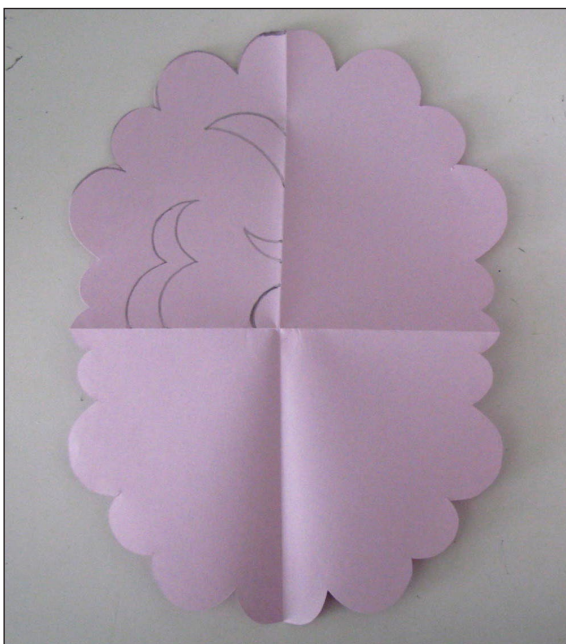
Etape N° 2