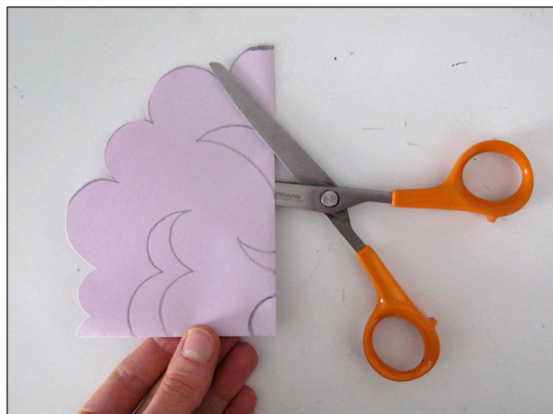
Etape N° 2 (suite)

Vous obtiendrez de superbes fleurs imaginaires.