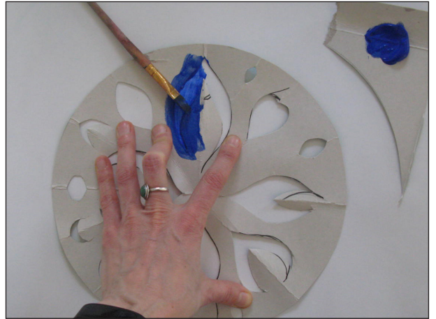
Etape N° 2

- Laisser bien sécher ce carton, car vous pourrez l'utiliser une autre fois.