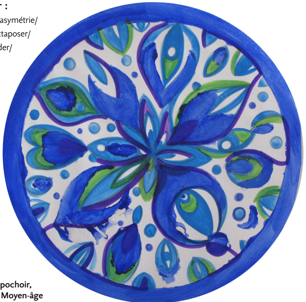
Une composition au pochoir, inspirée des vitraux du Moyen-âge ( exemples personnels )