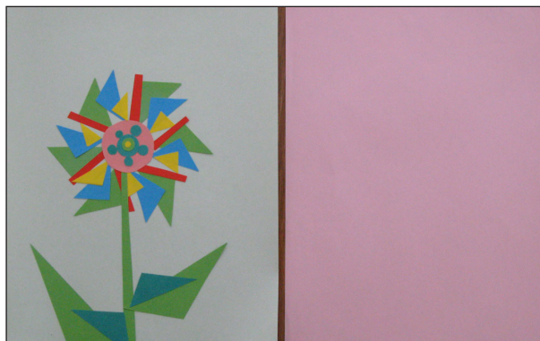
Etape N° 1

- Tu peux faire d'autres frottages de cette même fleur avec d'autres feuilles et d'autres couleurs, etc.