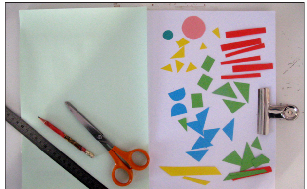
Etape N° 2