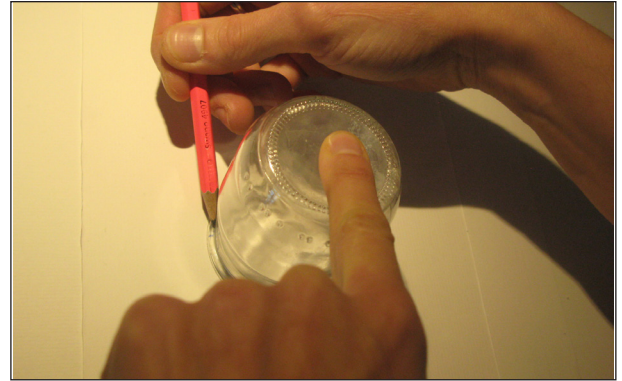
Etape N° 1

- Si vous aimez faire ce travail, pourquoi pas vous lancer dans la réalisation d'un jardin imaginaire sur une grande feuille ?