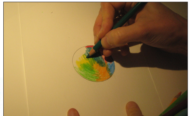
Etape N° 2