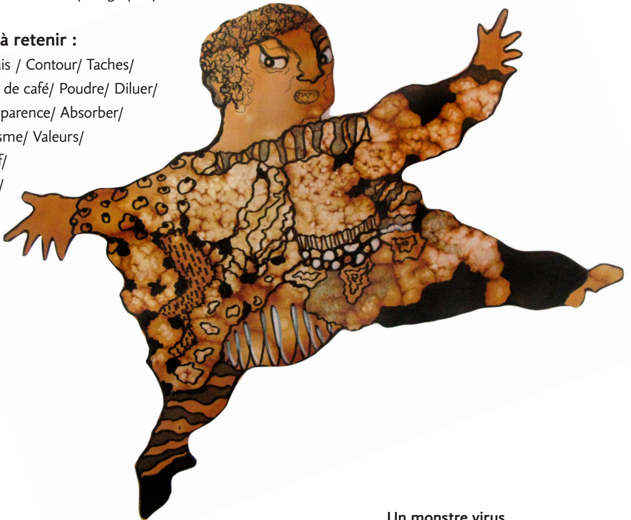
Un monstre virus ( exemple personnel)

Composer/ Épais / Contour/ Taches/ Matières/ Marc de café/ Poudre/ Diluer/ Intensité/ Transparence/ Absorber/ Motifs/ Graphisme/ Valeurs/ Visage expressif/ Monstre/ Ogre/ etc.