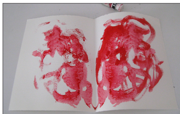
Etape N° 2