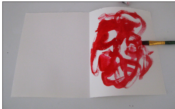
Etape N° 1