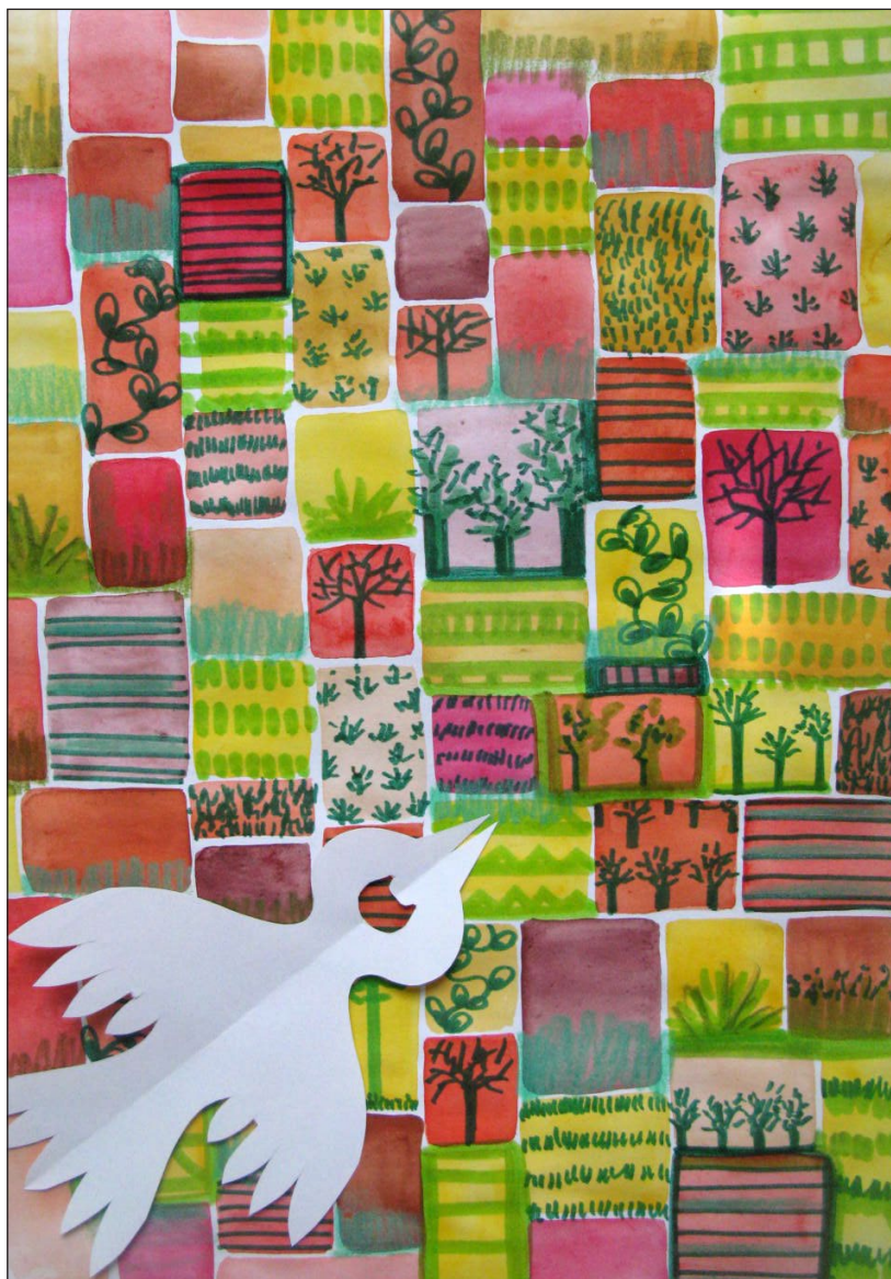
Un paysage graphique vu du ciel ( exemple personnel )