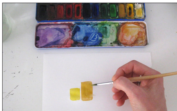
Etape N° 1